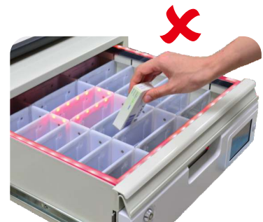
取藥位置錯誤 外框亮紅燈