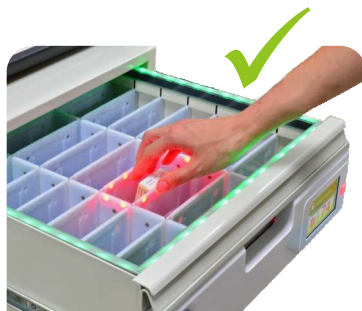
取藥位置正確 外框亮綠燈