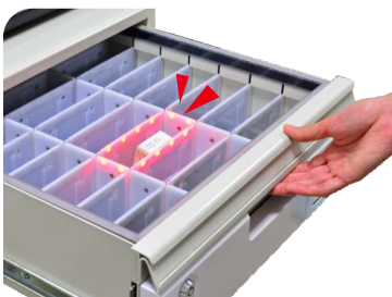
亮燈提示 藥物位置